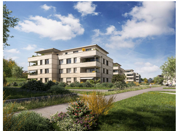
Wohnüberbauung "Coll d'Or"