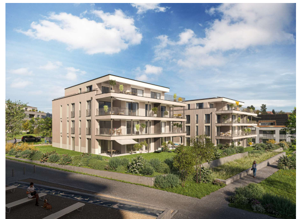
Wohnüberbauung "Coll d'Or"

Auf Wunsch vermitteln wir Ihnen auch gerne den Kontakt zu einem ZKB Berater in der Filiale Ihres Wohnorts.